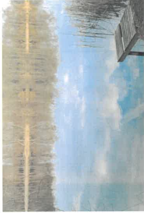
Widok na jezioro