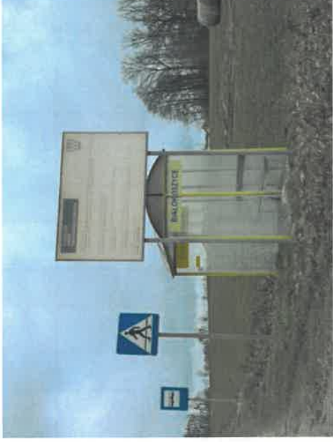
Przystanek przy drodze powiatowej