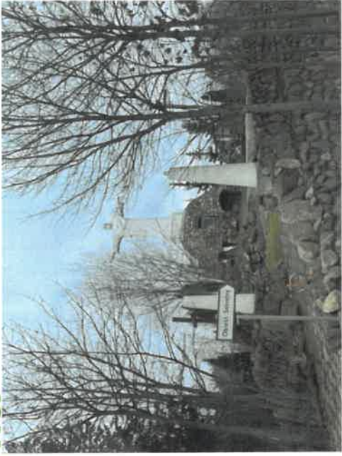
Obiekt sakralny tzw. Golgota