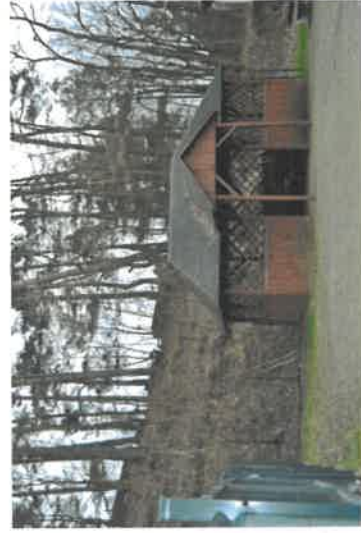
Altana przy świątelnicy