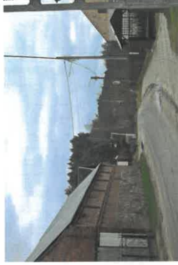
Droga gminna przez wieś