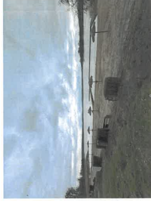
Plaża w Chrzypsku Wielkim