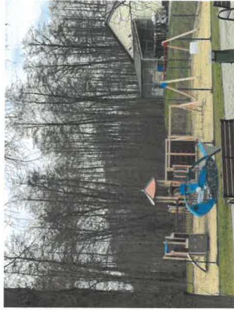
Jeden z placów zabaw w Chrzypsku