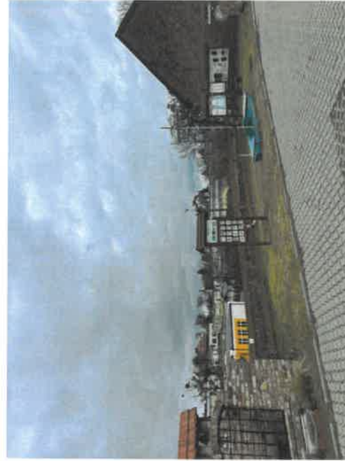
Ścieżka edukacyjna przy kościele