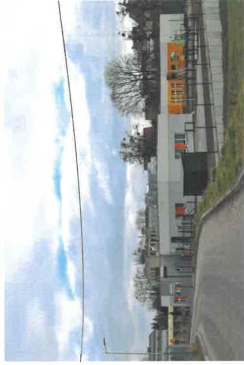
Przedszkole wraz z Klubem Dziecięcym