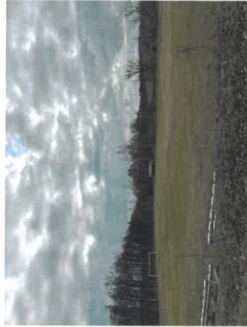
Boisko sportowe w Chrzypsku Wielkim