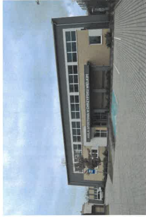
Hala sportowa w Chrzypsku Wielkim