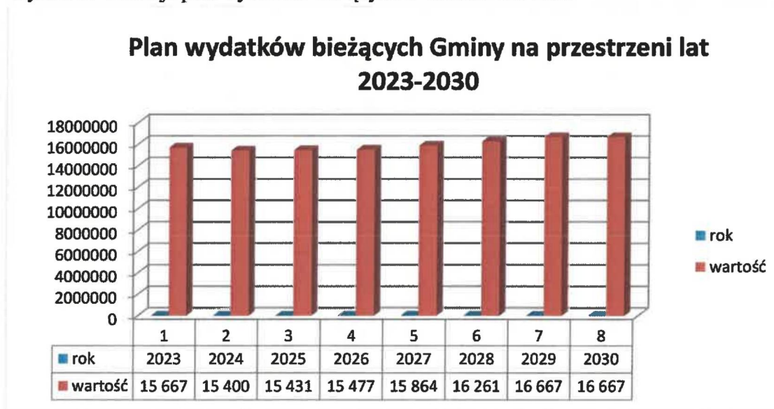
Wykres 3. obrazuje poziom dochodów bieżących i wydatków bieżących w latach 2023 -2030.