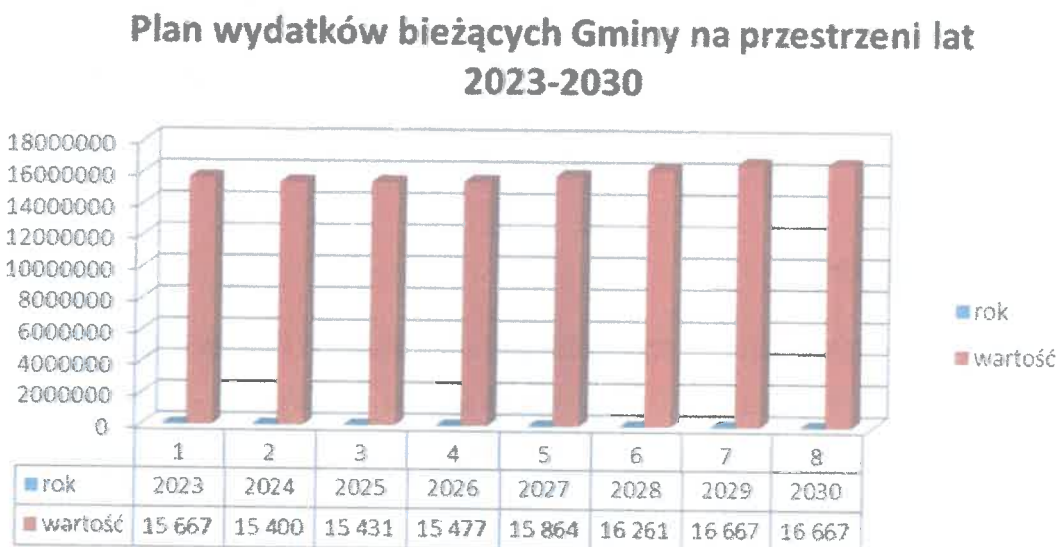
Wykres 3. obrazuje poziom dochodów bieżących i wydatków bieżących w latach 2023 -2030.