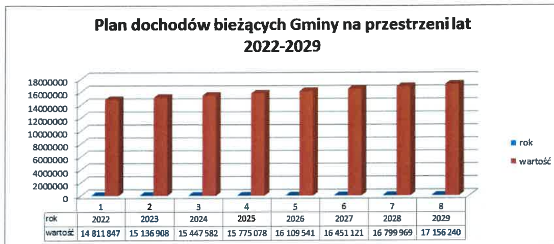
Wykres 1. obrazuje plan dochodów bieżących w latach 2022-2029