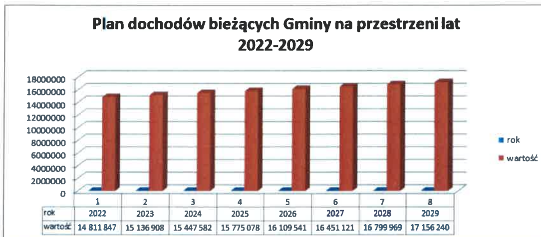
Wykres I. obrazuje plan dochodów bieżących w latach 2022-2029