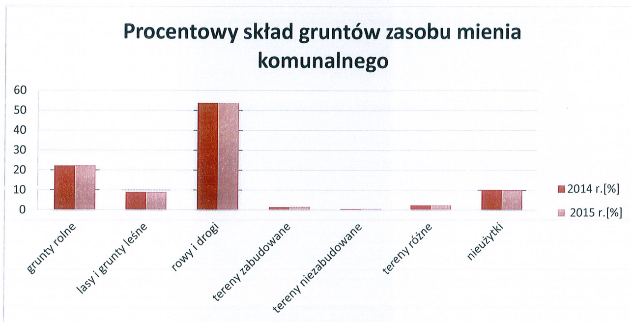
Rys.2. Przedstawienie procentowego składu gruntów zasobu mienia komunalnego na dzień 31 grudnia 2015 r. w porównaniu do roku ubiegłego.