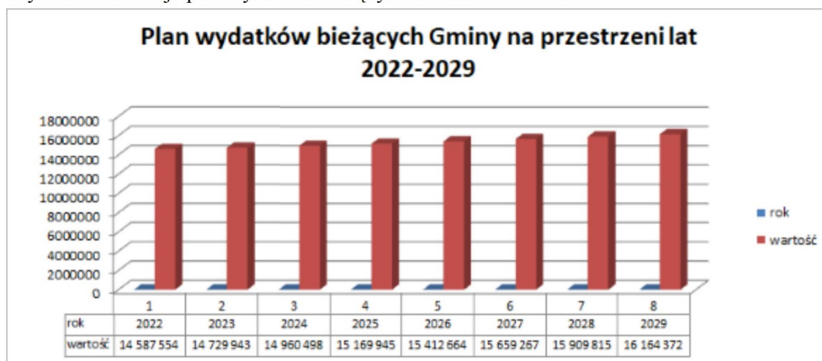
Wykres 2. obrazuje plan wydatków bieżących w latach 2022-2029

Gmina stara się o dofinansowanie ze środków zewnętrznych. Optymalizacja wydatków bieżących pozwoli realizować część inwestycji ze środków własnych. Jeżeli Gmina po złożeniu wniosków o dofinansowanie niektórych z inwestycji uzyska pozytywną opinię na otrzymanie dotacji to po zawarciu umów zostaną umieszczone stosowne zapisy mające odzwierciedlenie po stronie dochodów, przychodów i wydatków budżetu. Należy brać pod uwagę fakt, że brak finansowania ze środków zewnętrznych może spowodować wycofanie się z części inwestycji.